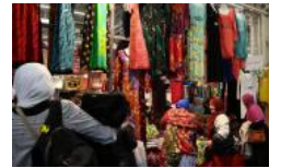
Rencontre annuelle des France : "le vote musul pas"