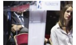
RECIT FRANCEINFO. Ce droite catholique est d omniprésente dans la c François Fillon