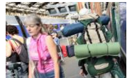
Quatre fois où des "ba touristes qui parcourir sur le dos, ont énérvé l