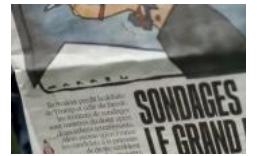
VIDEO. "Envoyé spécial sondages

"Dans 15 jours, Hamon A Villeurbanne, comme siphonné l'électorat du